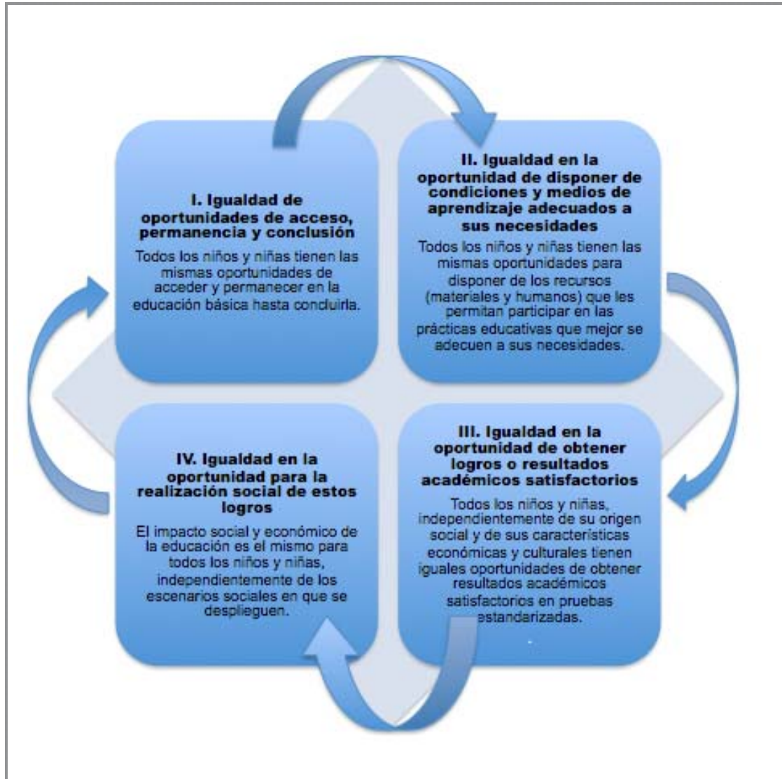
Figura 2. Modelo de equidad educativa propuesto para el CONAFE explicado