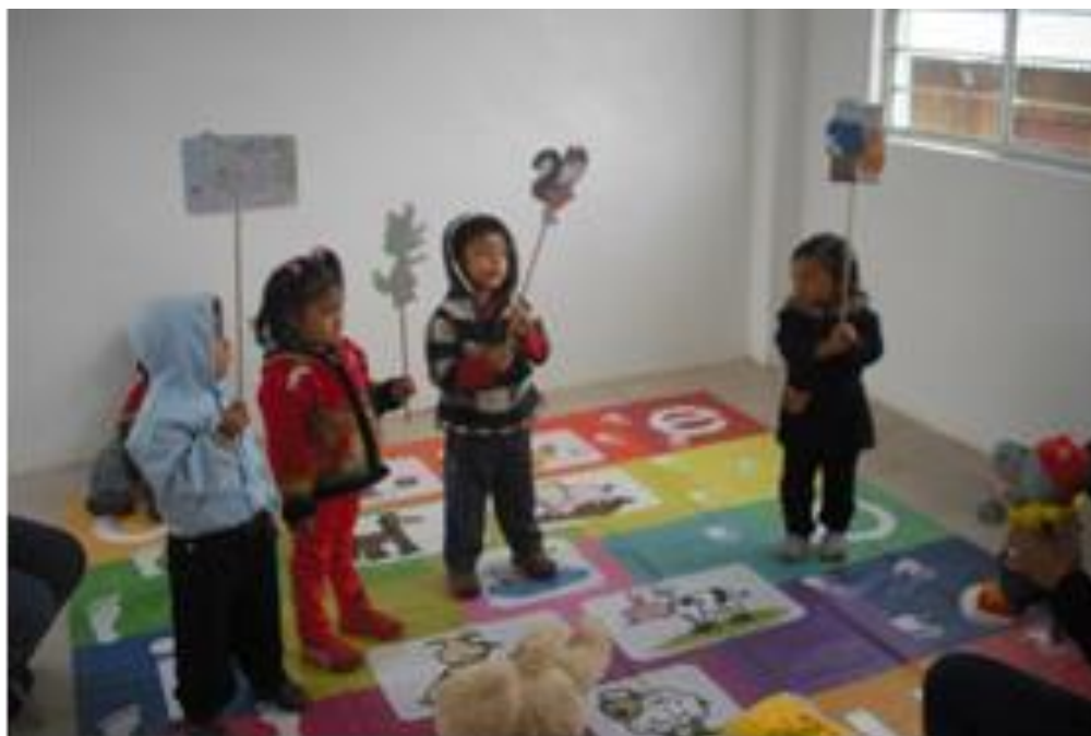
Niños del pilotaje, realizando una sesión de títeres interactivos

El proceso de sensibilización y concientización desplegado a lo largo del diplomado, así como la calidad humana de los conferencistas y demás equipo coordinador, le añadió coherencia y sentido a todas las actividades desarrolladas dentro del Programa. Este aspecto es uno de los más referidos por los participantes de la formación como importante motor de movilización. Estos atributos apalancaron cambios actitudinales y dispositionales en la atención a la primera infancia. No obstante, dichas movilizaciones no hubiesen tenido lugar sin la preparación, la constancia, creatividad, recursividad y sensibilidad de los agentes que se comprometieron con su proceso de formación y con el trabajo por sus comunidades. Esta disposición, sin duda, favoreció la experiencia práctica con Pisotón.