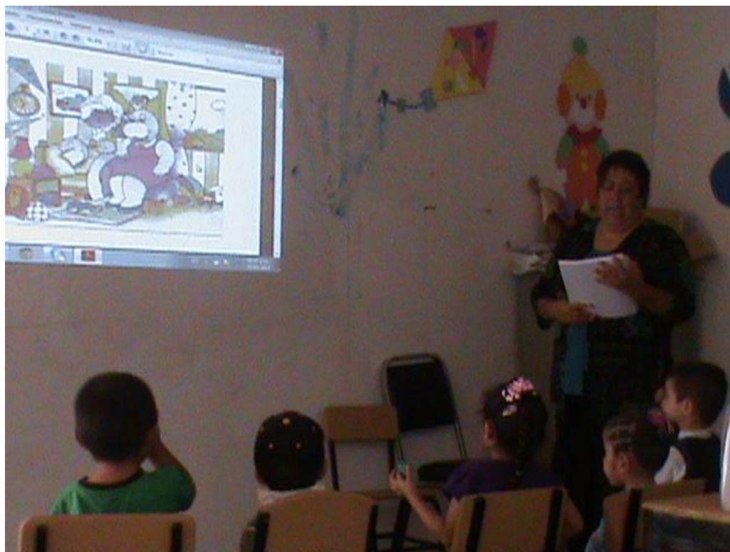
Diferentes estrategias para trabajar la implementación piloto con los niños y niñas

Adicional a esto, los agentes emplearon el material pedagógico enviado con responsabilidad, comprendiendo que la aplicación de las técnicas facilita la valoración de situaciones que están enmascaradas en la cotidianidad de nuestra niñez.