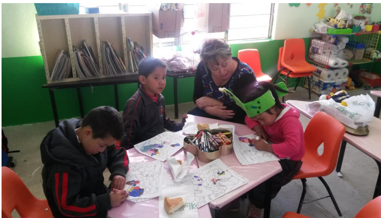
Agente educativa en actividades previas a la sesión con Pisotón

asesoría brindada por el programa, en el que se entrenó al grupo de líderes, se hizo especial énfasis en la importancia de trabajar la dimensión del “Ser” recalcando que cada acción debía estar encaminada a agenciar el desarrollo principalmente desde el reconocimiento del otro para que niños y niñas encuentren un espacio significativamente afectivo en el entorno educativo (institucional o no institucional), reflejado en actitudes positivas, el contacto visual, el tono adecuado de la voz y la postura que ofrece el cuidador.