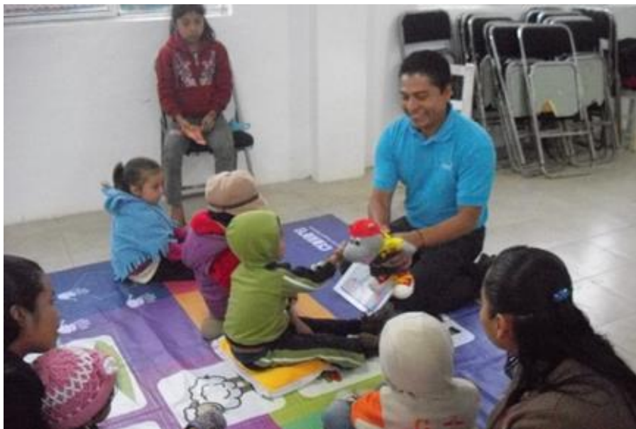
Lectura del cuento: Moni aprendiendo a bañarse solita

Simultáneamente al proceso del pilotaje y como una forma de enriquecer a los agentes frente al manejo del Programa, se continuó con la revisión de las teorías del aprendizaje y técnicas lúdico-educativas, en donde se abordaron los diferentes procesos del aprendizaje en el ser humano, sus implicaciones, consecuencias y alternativas lúdicas para armonizar con el desarrollo psicoafectivo.