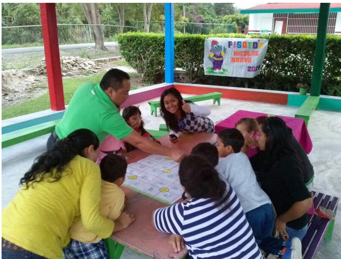
Estrategia para trabajar el juego con los padres de familia

Otro aspecto destacable es la autoafirmación que muchos agentes reportan, respecto a su grado de concientización y sensibilidad frente a la importancia de darle prioridad no solo a las necesidades físicas que presentan los niños y las niñas, sino también a las emocionales.