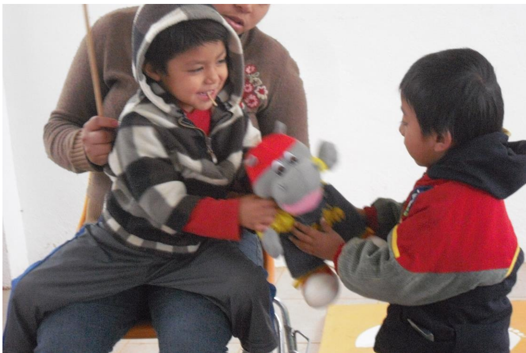
Niños del pilotaje compartiendo a Pisotón

El acompañamiento y la asesoría adelantada por las psicólogas in situ, y los líderes que acompañaron cada grupo, fueron decisivos para el pilotaje. Al momento de evaluar los resultados de la implementación in situ se destacan los logros alcanzados por los equipos que estuvieron monitoreados por aquellos líderes que mantuvieron una constante comunicación con el programa, se esforzaron por iniciar oportunamente el seguimiento, y demostraron un alto interés por guardar los lineamientos técnicos del mismo.